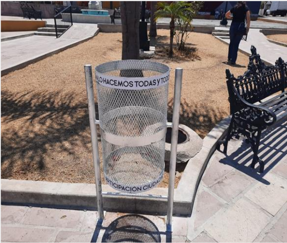
Colocación de Botes para Basura en Colonia 23 de mayo Sagrado Corazón de Jesús y parque los Cristeros.