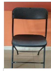
15.- SILLAS PLEGABLES