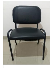
16.-SILLAS DE PIEL NEGRAS