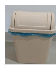
14.- BOTE DE BASURA BEIGE