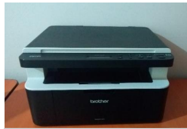
2.- IMPRESORA BROTHER