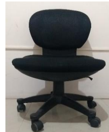
8.- SILLA EMPRESARIAL DE LLANTAS NEGRA