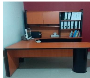
3.- ESCRITORIO CON LIBRERO DE MADERA