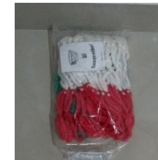
7.- RED DE BASQUETBOL