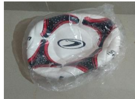
2.- VALÓN DE FUTBOL