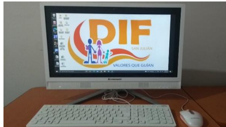
1.- COMPUTADORA LENOVO, MOUSE,TECLADO.