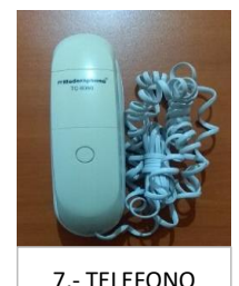
7.- TELEFONO ALAMBRICO BLANCO