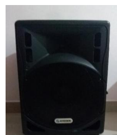
10.- BOCINA STEREN