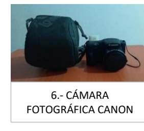
6.- CÁMARA FOTOGRÁFICA CANON