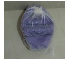
5.- VALÓN DE BASQUETBOL