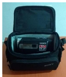
9.- CÁMARA DE VIDEO SONY