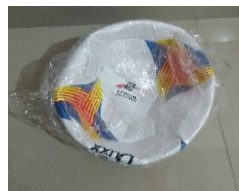
3.- VALÓN DE VOLEIBOL