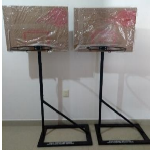
1.- TABLEROS PORTÁTILES DE BASQUETBOL