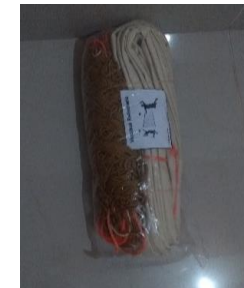
6.- RED DE VOLEIBOL