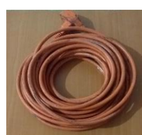
11.- EXTENSIÓN NARANJA