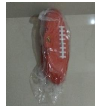
4.- VALÓN DE FUTBOL AMERICANO