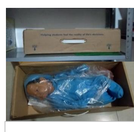
12.- BEBE SIMULADOR