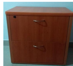
5.- CAJONERA DE 2 CAJONES