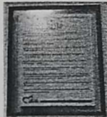
21. CUADRO DEL DECALOGO DE LOS SERVIDORES PUBLICOS