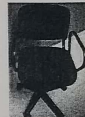
15. SILLA SECTARIAL NEGRA