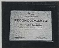
12. CUADRO COLOR CAFÉ OSCURO T/CARTA "DEL 1º LUGAR A NIVEL ESTADO EN EL AREA DE ALUMNETARIA"