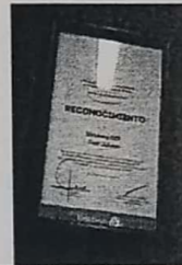
14. CUADRO COLOR CAFÉ OSCURO T/OFCIO "DE CERTIFICACION EN ATENCION A POBLACION EN