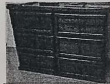
6. MUEBLE DE 6