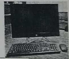
18. COMPUTADORA DE ESCRITORIO MARCA HP DE 23"