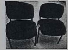
9. SILLAS TELA NEGRO