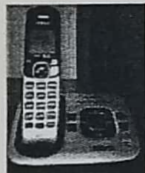
11. TELEFONO NEGRO/GRIS CON BASE