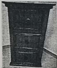
2. ARCHIVERO DE MADERA RUSTICO