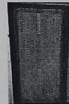
8. CORTINAS BEIGUE EN LA PUERTA