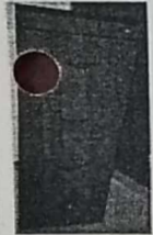
1. ARCHIVERO CAOVA