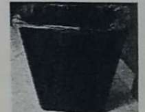
17. BOTE/ BASURA NEGF