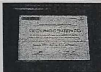
13. CUADRO COLOR CAFÉ OSCURO T/CARTA "DE CERTIFICACION COMO EDIFICIO LIBRE DE HUMO"