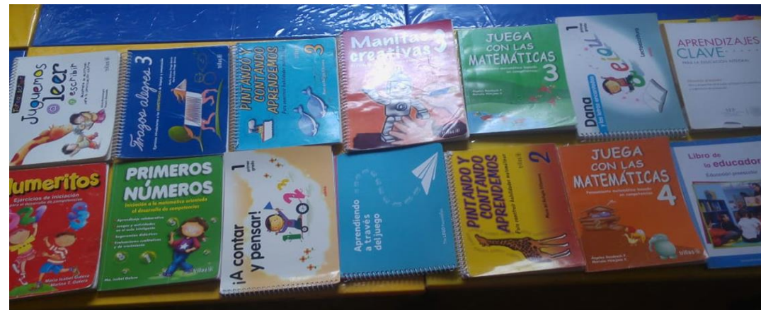
42- 14 LIBROS ACADEMICOS