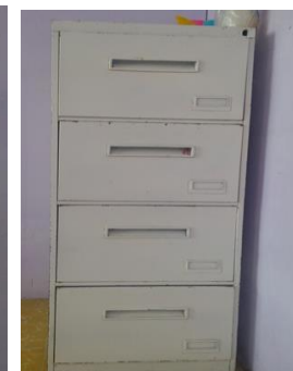
5- ARCHIVERO DE FIERRO COLOR BLANCO