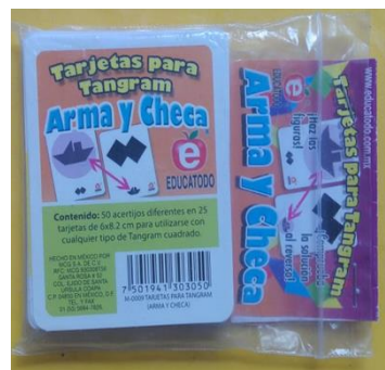
2- TARJETAS PARA TANGRAM