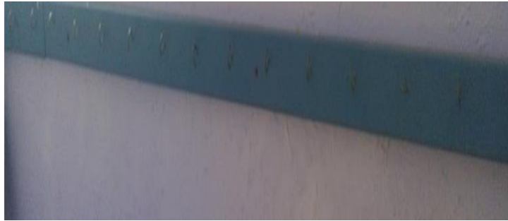
11- PERCHERO DE MADERA CON 22 CLAVIJAS