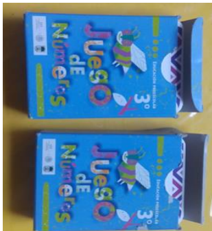
21- JUEGO DE NUMEROS