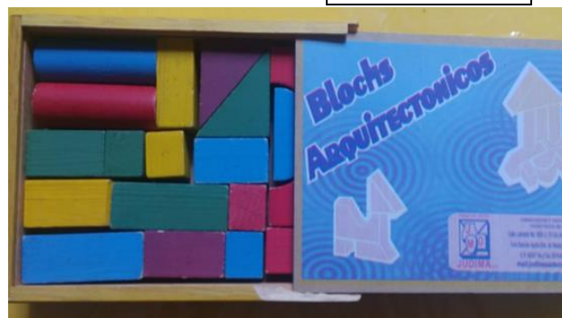
30- CAJA DE BLOCKS ARQUITECTONICOS