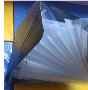
14- FOLDER ABANICO DE PLASTICO NEGRO