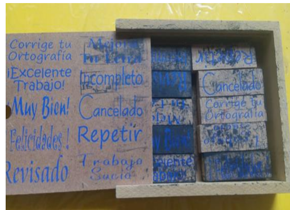
38- CAJA CON 10 SELLOS EDUCATIVOS