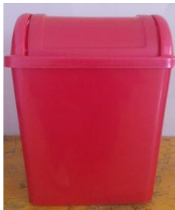
40- BOTE DE BASURA COLOR ROJO