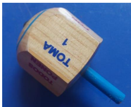
29- PIRINOLA DE MADERA