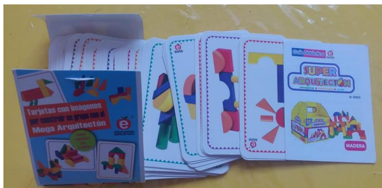
25- TARJETAS CON IMÁGENES MEGA ARQUITECTON