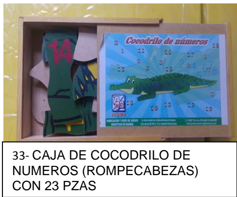
33- CAJA DE COCODRILLO DE NUMEROS (ROMPECABEZAS) CON 23 PZAS