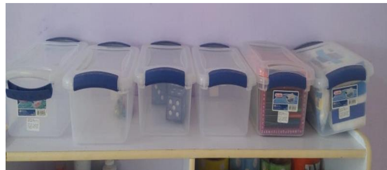
8- CONTENEDORES TRANSPARENTES CON TAPA