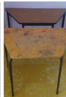
9- MESAS CAFÉ DE MADERA