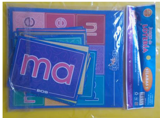
39- JUEGO DE LOTERIA DE SILABAS