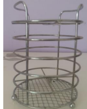
18- LAPICERO DE METAL