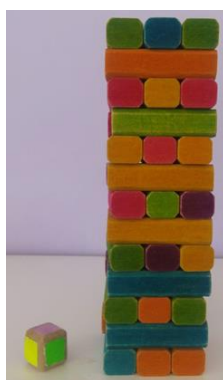
26- JENGA DE COLORES Y DADO DE MADFRA