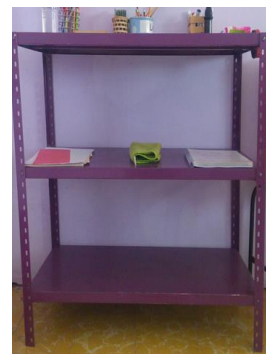
7- ESTANTE DE FIERRO CON 3 DIVICIONES