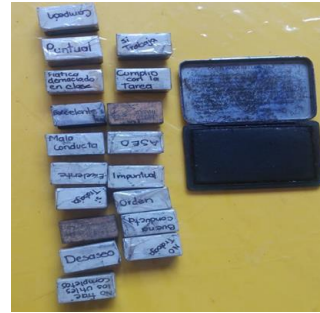
13- SELLOS PARA REVISAR