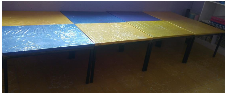
37- 3 MESAS AZULES Y 5 MESAS AMARILLAS