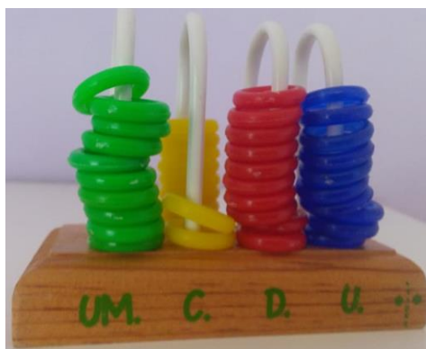
27- CONTADOR DE AROS DE COLORES