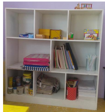
6- MUEBLE DE GUARDA DE MADERA BLANCO DE 8 DIVICIONES