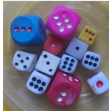
17- DADOS DE DIFERENTES COLORES Y TAMAÑOS