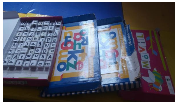
1- ALFABETO MOVIL 3RO