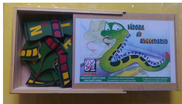
31- CAJA DE VIBORA DE ABECEDARIO (ROMPECABEZAS) CON 32 PZAS