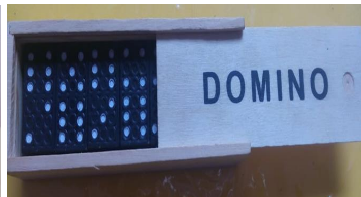
28- DOMINO DE MADERA COLOR NEGRO