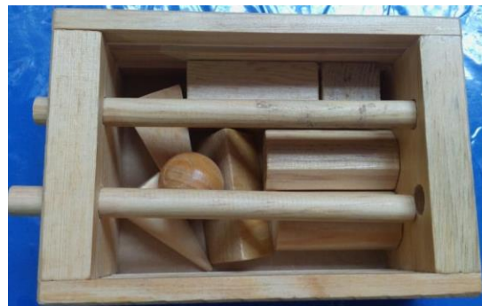
41- JUEGO DE MADERA DE FIGURAS GEOMETRICAS