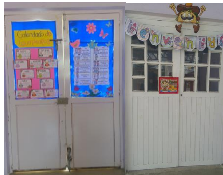
3- DOS PUERTAS BLANCAS