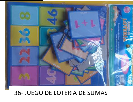
36- JUEGO DE LOTERIA DE SUMAS