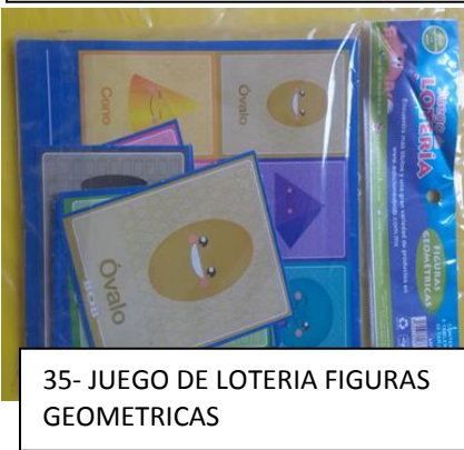
35- JUEGO DE LOTERIA FIGURAS GEOMETRICAS