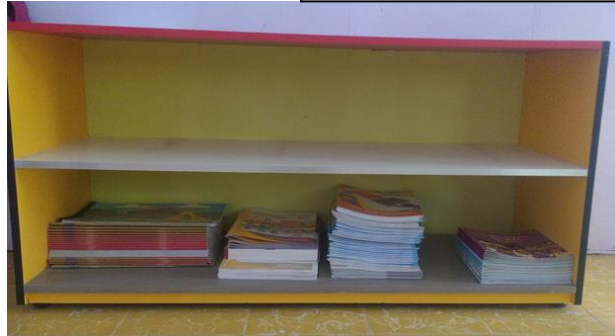
22- MUEBLE DE GUARDA CON DOS DIVISIONES COLOR AMARILLO Y ROJO