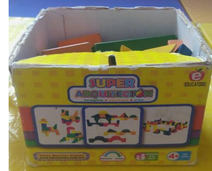
24- CAJA SUPER ARQUITECTON