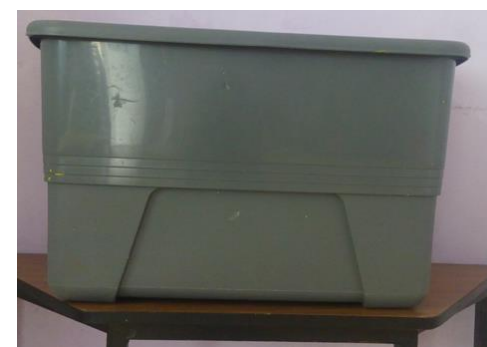
32- CONTENEDOR DE PLASTICO COLOR VERDE