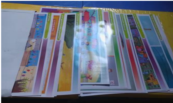
16- LAMINAS DIDACTICAS