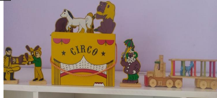
23- EL CIRCO CON 18 PZAS Y UN CAMIONCITO DE MADERA