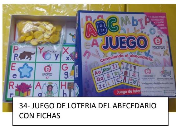
34- JUEGO DE LOTERIA DEL ABECEDARIO CON FICHAS